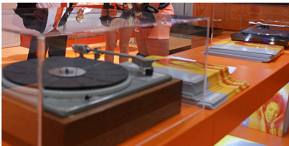
Vinyl er i gang med et stort comeback. (Foto: lydogbillede.dk)

Af: John Alex Hvidlykke, lydogbillede.dk